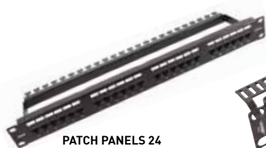
PATCH PANELS 24 PUERTOS 19" UTP CAT.6