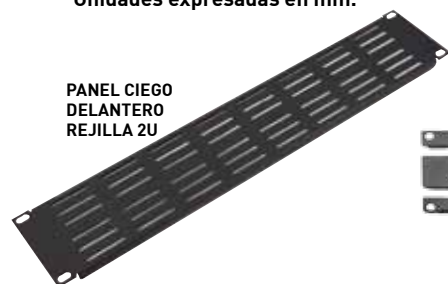
PANEL CIEGO DELANTERO REJILLA 2U