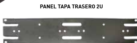
PANEL TAPA TRASERO 2U