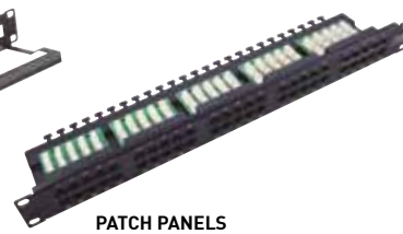
PATCH PANELS 50 PUERTOS CAT.3 GA-571300