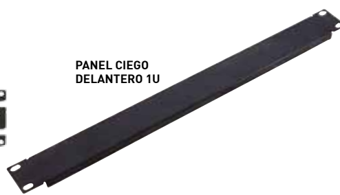
PANEL CIEGO DELANTERO 1U