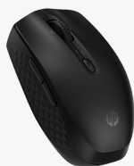
Ratón Bluetooth programable HP 420 7M1D3AA