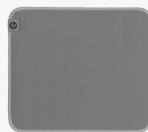
Alfombrilla de ratón HP 100 Sanitizable 8X594AA